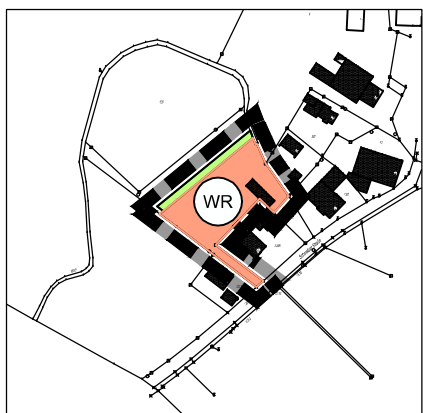
Änderungsplan M 1: 5.000