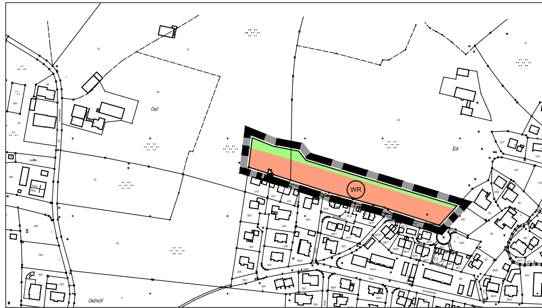
Änderungsplan M 1: 5.000