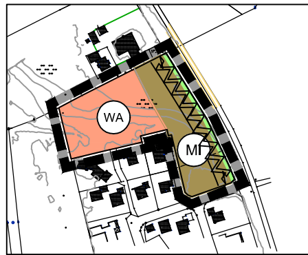
Änderungsplan M 1: 5.000